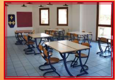
Une salle d'activité modulable