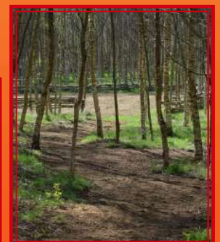
Parc à jeux