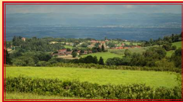
Le village de Verrières en Forez

A votre disposition tout au long de votre séjour :