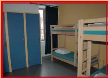
Une des chambres, bâtiment historique