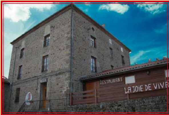
Vue extérieure du centre

A deux pas du bourg du village de Verrières en Forez, le centre de la Joie de Vivre peut accueillir jusqu'à 130 personnes. Proche de Montbrison, le petit village de Verrières en Forez est situé dans ces montagnes foréziennes dites du « soir ».