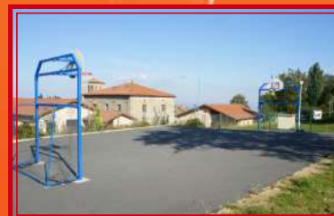
Terrain de basket